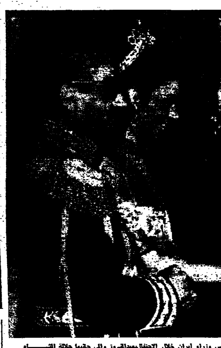
الامبراطورة فرج تقدم قلعة عمدة لزيارة السيد امير عيسى حيدر بن علي وزير ايران خلال الاحتفال بعيد الفريز والى جنبها جلالة القسام

اعلان تعلن وكالة الفوت الدولية انه سيجري توزيع المون عن شهر آذار ١٩٦٨ للنازحين واللاجئين المقعنين في - ٣٦ - ٣٨ - ٣٧ في مركز توزيع الزرقاء القديم.